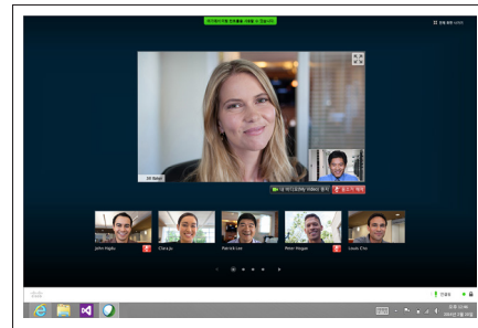
그림 2. 전체 화면 모드의 보기

WebEx Video Bridge를 사용하면 다른 사람들이 내 개인 미팅룸에 더 쉽게 들어 올 수 있습니다. 모든 표준 기반의 비디오 시스템에서 비디오 미팅에 참석할 수 있습니다.