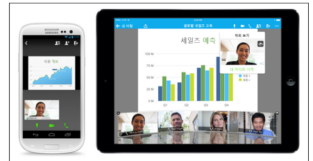
그림 3. 어떤 디바이스에서나 미팅 가능

Android, iPhone 및 iPad, BlackBerry 10, Windows Phone 8 디바이스 등 어디서든 오디오, 비디오, 콘텐츠 공유 기능을 사용하면서 효과적으로 미팅을 할 수 있습니다.